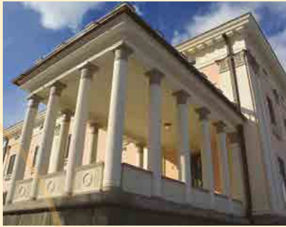
Emil Aaltosen museo